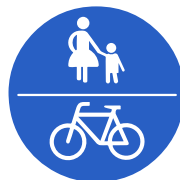
Verkehrszeichen 240 „Gemeinsamer Geh- und Radweg“