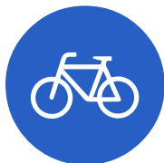
Verkehrszeichen 237 „Radweg“

Wenn der Gehweg durch das Verkehrszeichen 240 für Radfahrer freigegeben ist, darf auch dieser mit Fahrrädern befahren werden. Ansonsten dürfen nur Kinder bis zum vollendetem 10. Lebensjahr den Gehweg mit dem Rad befahren.