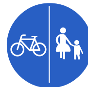
Verkehrszeichen 241 „Getrennter Rad- und Gehweg, Radweg links“

+++ Lohnt sich ein Einspruch gegen den Bußgeldbescheid? Prüfen Sie jetzt Ihre Möglichkeiten auf www.sos-verkehrsrecht.de ! +++