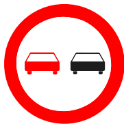
Verkehrszeichen 276 „Überholverbot für Kraftfahrzeuge aller Art“

Achtung! Durch die StVO-Novelle kann durch Verkehrszeichen 277.1 nunmehr auch das Überholen von einspurigen Fahrzeugen verboten sein. Achten Sie zudem darauf, beim Überholen von Fußgängern, Radlern und Fahrern von E-Scootern ausreichend Seitenabstand einzuhalten. Innerorts sind mindestens 1,5 m und außerorts mindestens 2 m Seitenabstand zu ihnen einzuhalten.